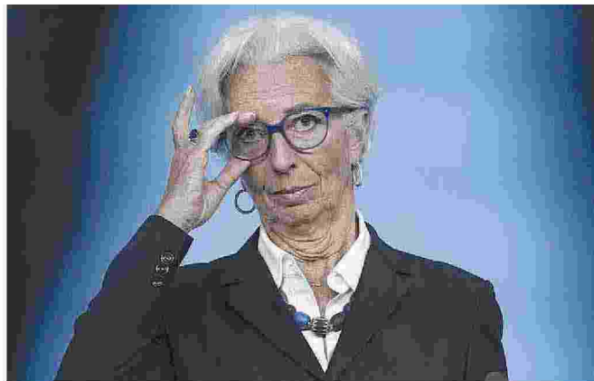
Christine Lagarde, a capo della Banca Centrale europea