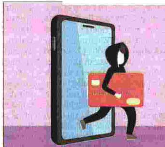
Le falle del Registro delle opposizioni In 12 mesi sono stati 3,3 milioni gli italiani che hanno subito una truffa telefonica con un danno di quasi 400 milioni